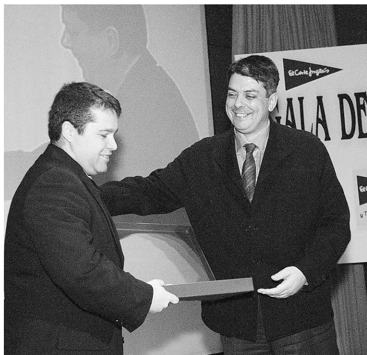
UREÑA. El seleccionador de voleibol fue uno de los premiados.